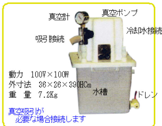
真空装置/オプション